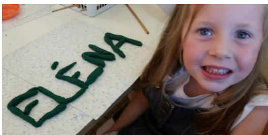
GS : Nous avons écrit notre prénom en pâte à modeler