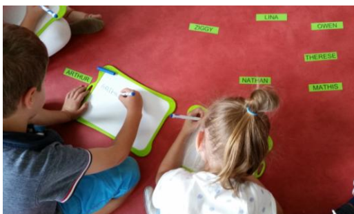
GS : Il faut retrouver son prénom en écriture capitale et scripte, nommer son initiale et la faire chanter, jouer au jeu des prénoms...