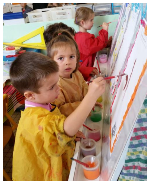
MS : Il faut tracer, peindre des lignes horizontales. Reconnaître son initiale, son prénom...