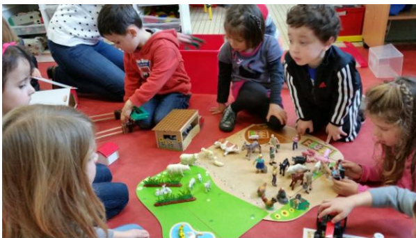
MS/GS : vocabulaire autour de la ferme : animaux/habitation/alimentation...