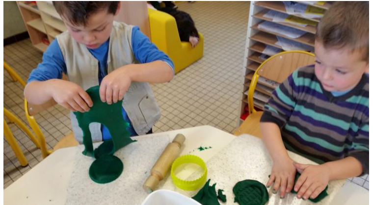
MS: utiliser des outils, des matériaux pour modeler des fonds de tartes et fabriquer des colombins pour faire le tour et reproduire le sens du rond...