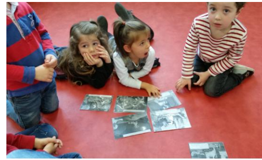
MS : Raconter l'histoire de Filou, ordonner les images d'une histoire...