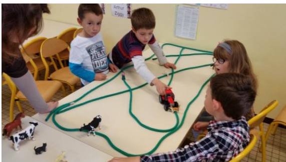
GS : se repérer dans l'espace, suivre un chemin codé. Apprendre à dessiner/peindre des animaux de la ferme : vache, cochon, poule....