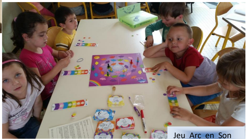
Jeu Arc en Son