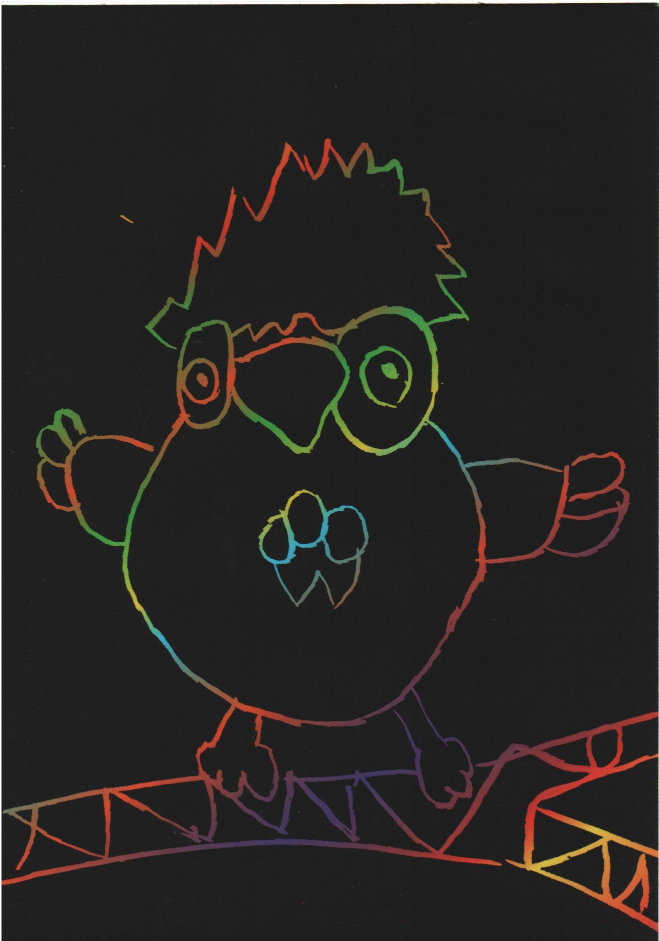
Owen Prenez-soin de vous !